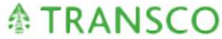
صندوق عمان لتنمية أبو ظبي للنقل و التحكم